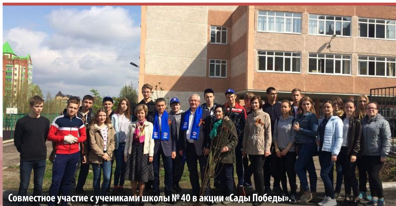
Совместное участие с учениками школы № 40 в акции «Сады Победы».